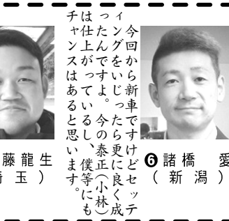
4 矢拓 (茨)